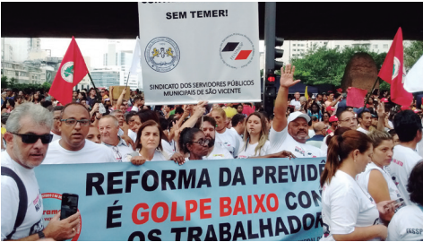
ESTIVEMOS na Paulista contra o GOLPE da Reforma Previdenciária

Pelo contrário: estivemos na linha de frente, ORGANIZANDO, convocando e marchando lado a lado com outras entidades sindicais e movimentos sociais em defesa da classe trabalhadora.