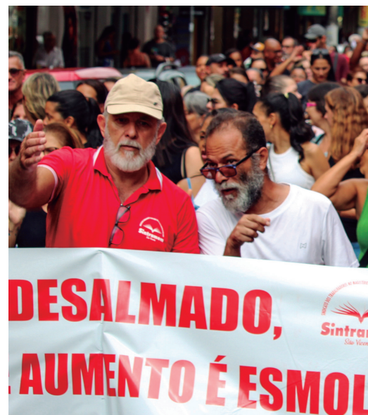
GREVE HISTÓRICA - Fomos pra ci

Conquistas da Última Gestão Pandemia (2020-2021): defesa da vida - São Vicente foi a primeira cidade a liberar os Professores na pandemia e a ÚLTIMA a retomar as aulas presenciais. Isso só aconteceu PORQUE o SINTRAMEM garantiu que o retorno dos EDUCADORES OCORRESSE após a segunda dose da vacina contra a Covid-19. Uma vitória que preservou vidas e mostrou a responsabilidade da DIREÇÃO SINDICAL em um momento crítico.