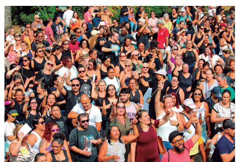
Estivemos em peso na Prefeitura e na Câmara para cobrar respeito

O INÍCIO FOI DIFÍCIL , com RESPONSABILIDADES MISTURADAS e a PREFEITURA enfrentando crise financeira. O quadro de sócios CRESCIA lentamente.