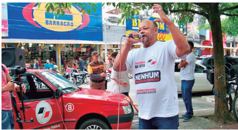
SCHEL , 1º presidente do SINTRAMEM na luta contra o GOLPE

Estivemos nas RUAS quando a democracia brasileira foi atacada em 2016 , denunciando o golpe que abriu caminho para a retirada de direitos históricos. Enfrentamos a Reforma da Pre-