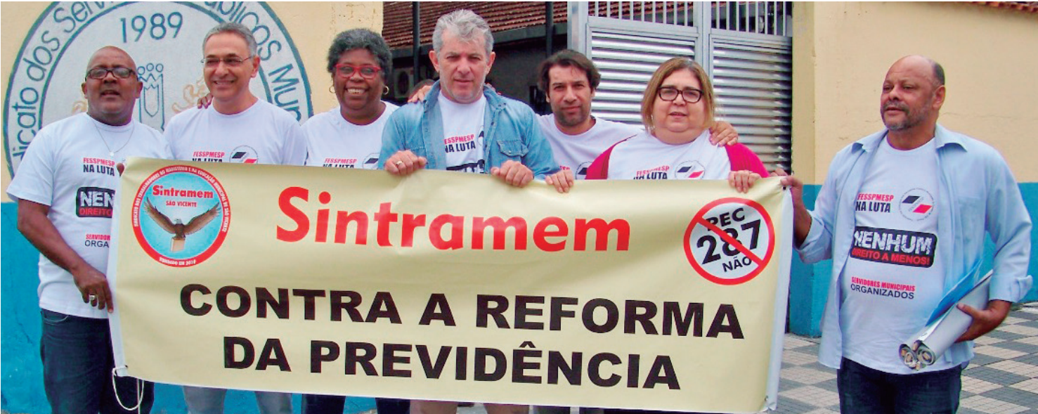
MANIFESTAÇÕES DE 2017 - Nossos diretores sempre estiveram na linha de frente contra os retrocessos

Desde sua fundação, o SINTRAMEM NUNCA SE LIMITOU apenas às pautas locais. Nossa história é marcada pela participação ativa em TODAS as grandes mobilizações nacionais que colocaram em jogo os direitos da classe trabalhadora.